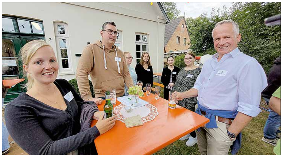
Das Team der LHV Steuerberatung.