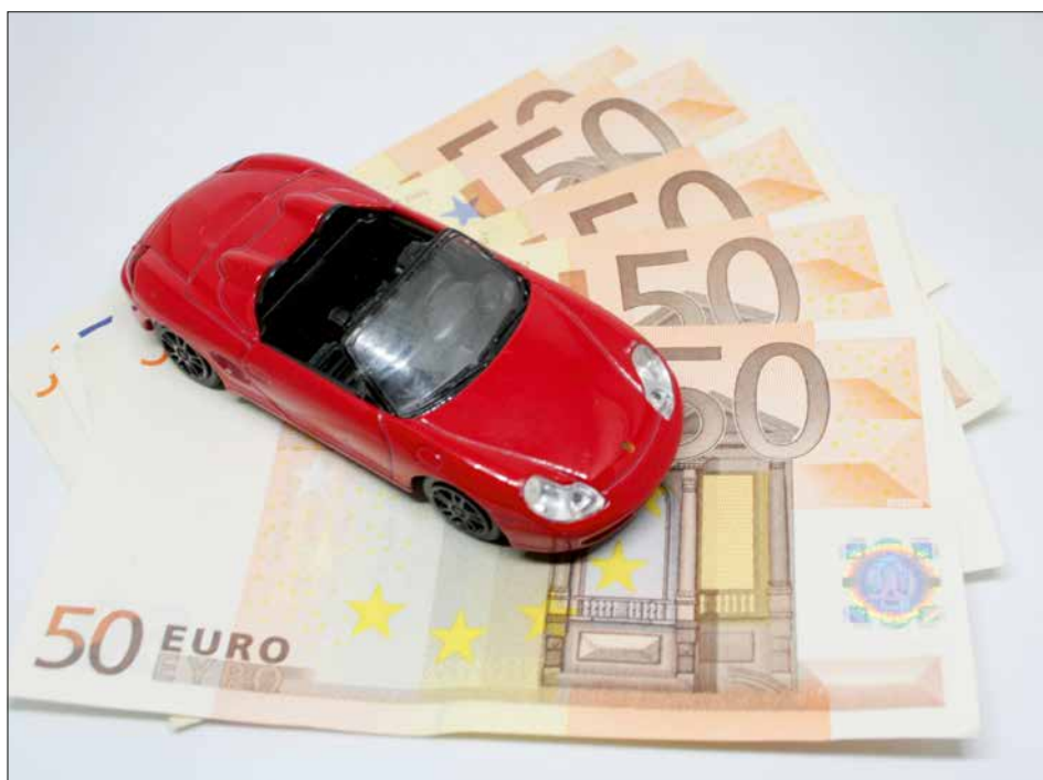
Der Schlepperpool bietet günstige Tarife für die gesamte Fahrzeugflotte eines Betriebs.