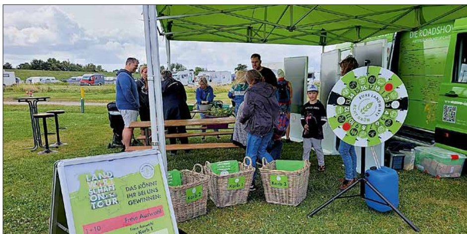
Das Glücksrad lockte viele Besucher an den Roadshow-Stand in Tossens.

Anfang August war die Roadshow unserer Imagekampagne „Eure Landwirte – echt grün“ am Friesenstrand in Tossens zu Gast – mit Glücksrad und digitalen Quiz-Stellen, Schafen aus der Deichschäferei Langwarden, einem Schlepper zum Probefahren und einer Mitmach-Bastelaktion. Bei strahlendem Sonnenschein haben insbesondere Urlauber-Familien vorbeigeschaut, mit denen sich viele Gespräche über Landwirtschaft ergeben haben.