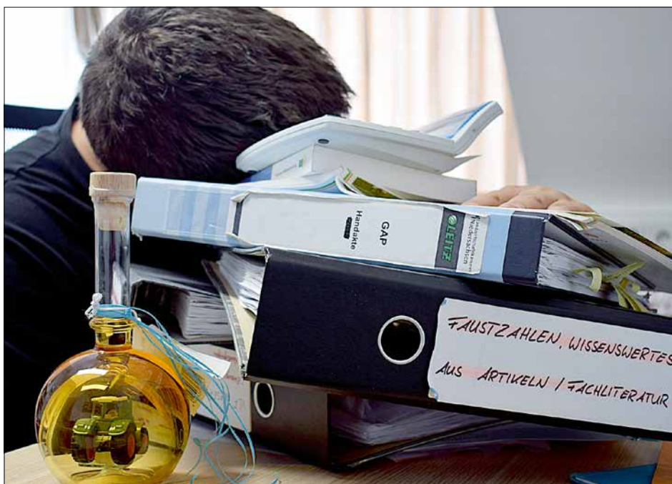
Immer höhere bürokratische Auflagen machen den Mitarbeitern in der „Grünen Buchführung“ wenig Freude.