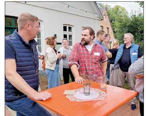
Vertreter des Maschinenrings Wesermarsch.