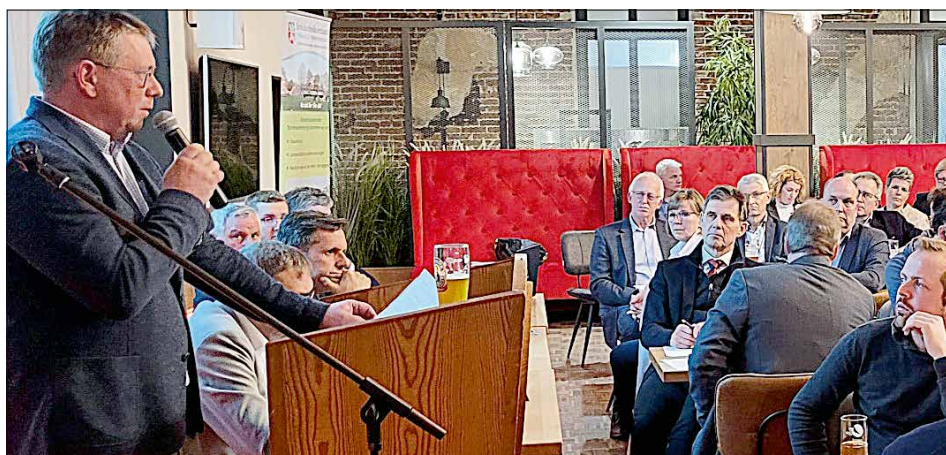
Die Herausforderungen der Energiewende waren Thema bei der Jahreshauptversammlung des Kreislandvolkverbands Friesland.

die Verlängerung der Tarifglättung im Steuerrecht. Unbefriedigend bleibt, dass deutsche Landwirte ab 2026 europaweit die höchsten Steuern auf Agrardiesel zahlen sollen; dass beim Wolf keine pragmatische Lösung in Sicht ist oder dass extrem kleinteilige bürokratische Vorgaben viel Zeit und Geld kosten.