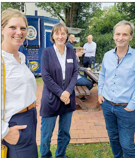
Vertreter des Grünlandzentrums.