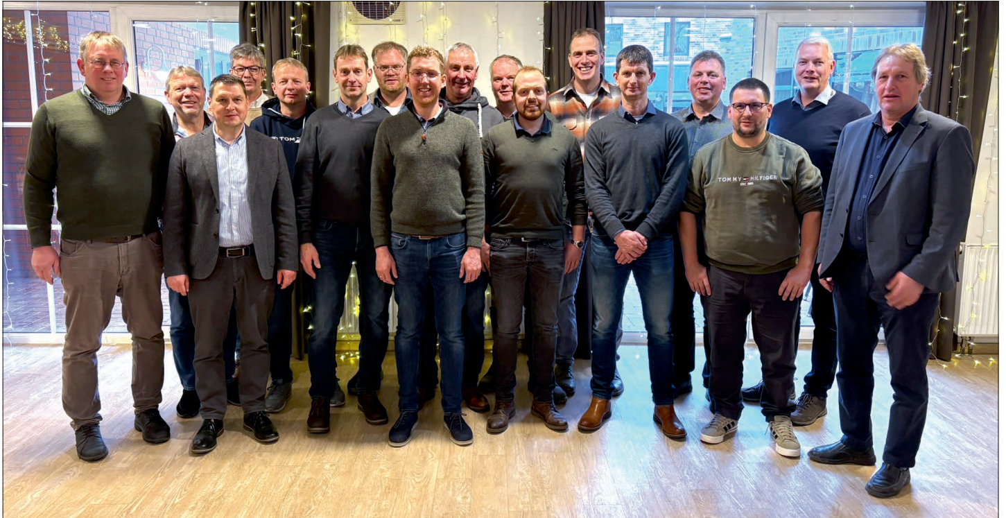
Starkes Team für 2026 – die Klausurtagung von Wesermarsch und Friesland im Forellenhof Walsrode

Am 7. und 8. Januar 2026 trafen sich die Vorstandsmitglieder der Kreisverbände Wesermarsch und Friesland sowie Mitarbeitende der Geschäftsstelle zu einer zweitägigen Klausurtagung im Forellenhof in Walsrode. Trotz Schnee und Eis erreichten alle Teilnehmenden den Tagungsort sicher. Ziel war es, die Verbandsarbeit gemeinsam zu reflektieren und Schwerpunkte für 2026 zu setzen.