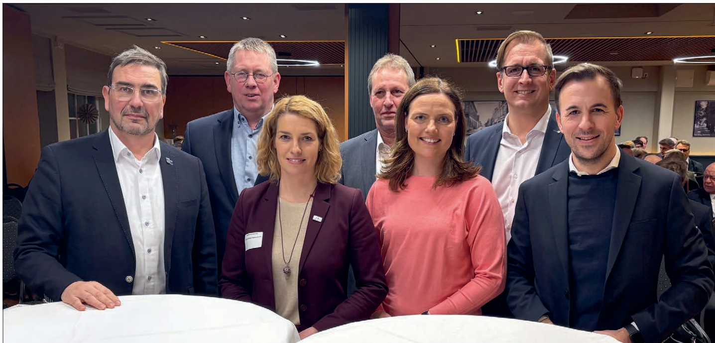
Politische Gäste und Vertreter der Kreislandvölker nutzten den Abend für den direkten Dialog zu regionalen und bundespolitischen Themen.