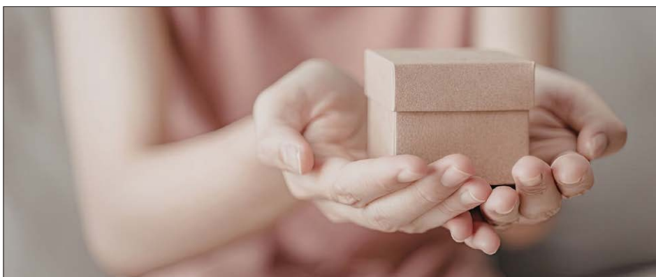
Eine frühzeitige Absicherung kann zum wertvollsten Geschenk für die Zukunft werden.

Euer Kind hat große Pläne: Ausbildung, Studium, Hofübernahme, Betriebsleiter oder vielleicht auch eine Weltreise? Alles, was es sich erträumt, baut auf einer einzigen Basis auf – der Arbeitskraft. Aber was, wenn diese Kraft plötzlich nachlässt? Ohne Einkommen wird es schwer, Träume zu verwirklichen.